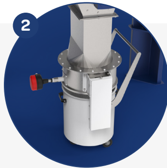
Option Seau 0,12m³